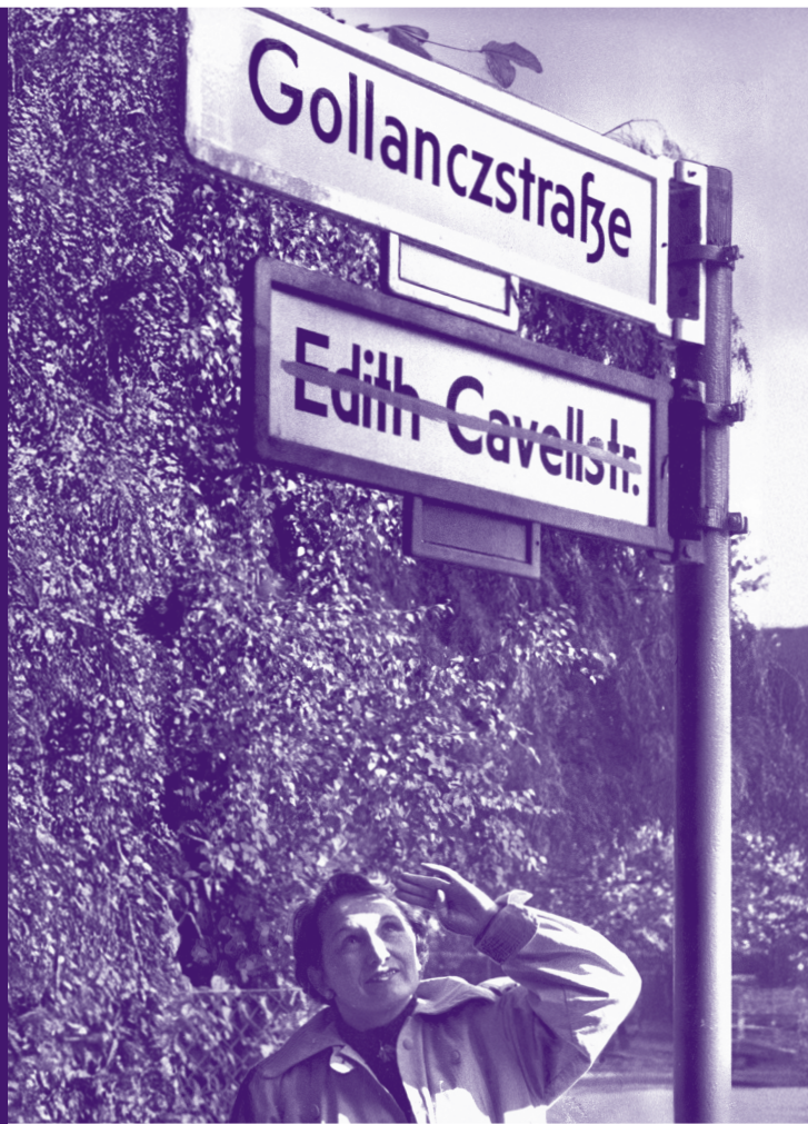
Titelbild: Umbenennung in Gollanczstraße, 1955 | Ullstein Bild. Bildnr. 04633233

um benennen?! Berlins Straßennamen und ihre Geschichte